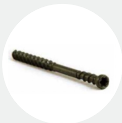
PROTECH KORROSIVITETSKLASS C4

Skruv i härdat stål, skyddad med ProTech Coating